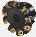
フェースミルカッター M5009 (45°)