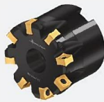
フェースミルカッター M5012 (88°)